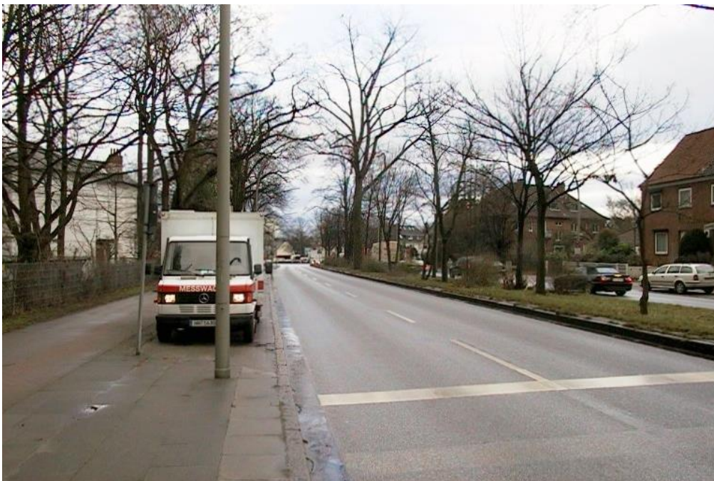
Abb.: Der Messwagen am Messort 1 am Osdorfer Weg (Fahrtrichtung stadtauswärts rechts) (Blickrichtung des oberen Bildes: Nordwest, Blickrichtung des unteren Bildes Südost)

Die Straße hat in diesem Bereich zwei breite Fahrspuren pro Fahrtrichtung, die durch einen bepflanzten Mittelstreifen getrennt sind. Der Standort auf dem Parkstreifen grenzt direkt an die Fahrspur, die stadtauswärts führt. Jenseits des Fußweges gibt es zahlreiche Bäume, die die Messungen möglicherweise beeinflussen. Eine geschlossene Bebauung gibt es in diesem Bereich der Straße nicht. In ca. 400 Metern Entfernung (im unteren Bild „ganz hinten“) läuft die Autobahn A7.